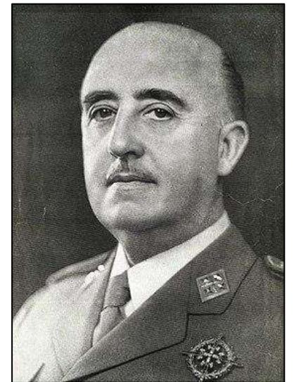
Рис. 4. Генерал Ф. Франко.

Война закончилась в марте 1939 г. победой Франко и установлением авторитарного режима (СССР в 50 раз уступал итало-германской коалиции).