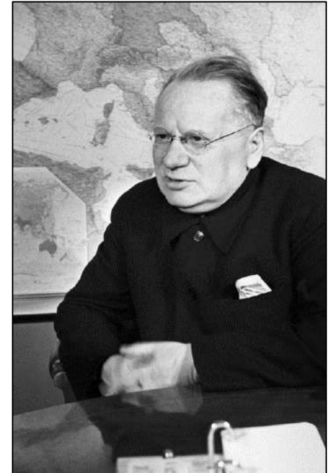
Рис. 2. Нарком иностранных дел СССР М.М. Литвинов.

Май 1935 г. СССР заключил договоры о взаимопомощи с Францией и Чехословакией (победа советской дипломатии).