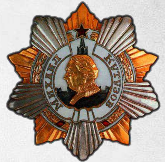
Рис. 15. Орден Кутузова I степени.

За годы Великой Отечественной войны КМК выдал такое количество стали на нужды фронта, что из него можно было бы изготовить: