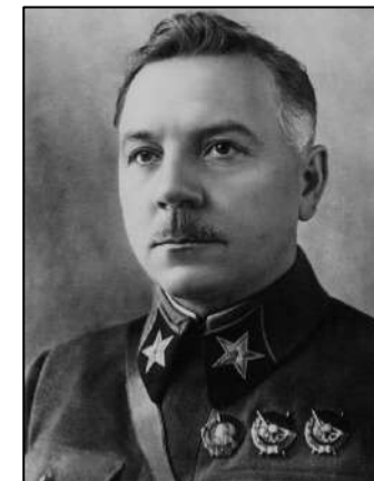
Рис. 14. Народный комиссар по военным и морским делам СССР и член Политбюро ЦК ВКП(б) К.Е. Ворошилов

В марте 1940 г. мирный договор был подписан в Москве.