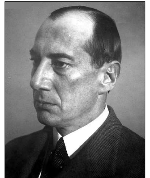
Рис. 10. Министр иностранных дел Польши Ю. Бек.

26 августа военные миссии покинули Москву. Переговоры были сорваны Великобританией и Францией.