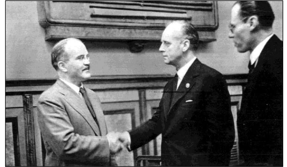
Рис. 11. В. Молотов и И. фон Риббентроп.