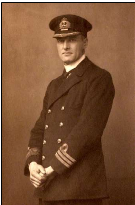
Рис. 8. Глава английской делегации адмирал Реджинальд Дракс.

Причина провала: Переговоры зашли в тупик в вопросе пропуска Красной армии через территорию Польши и Румынии.