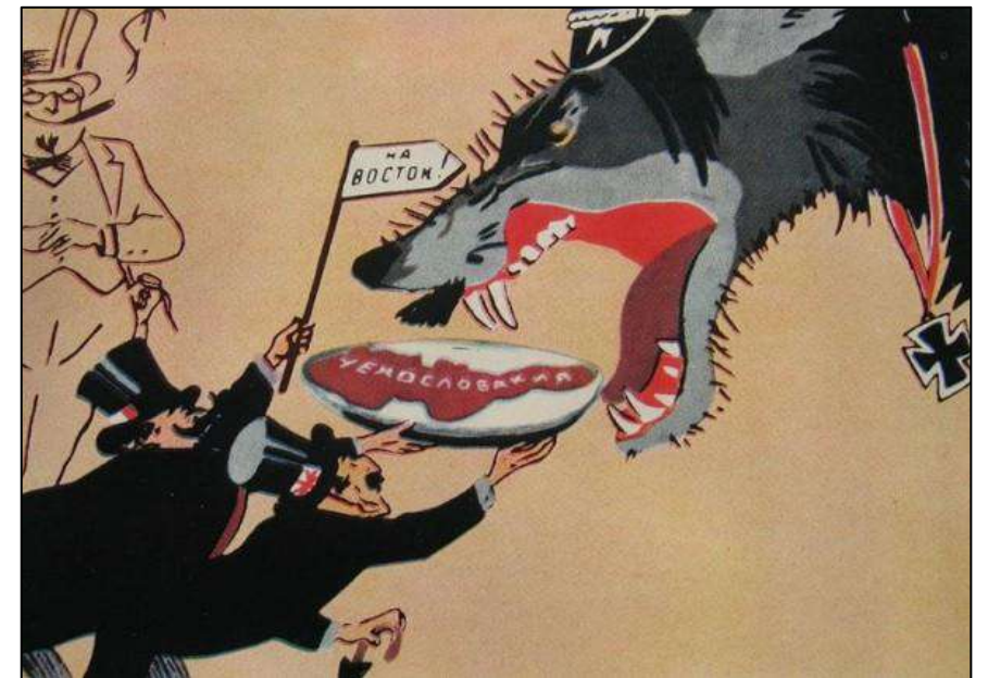
Рис. 5. Кукрыниксы. «Мюнхенский сговор»

Соглашение подписали: Великобритания, Франция, Германия, Италия, Польша и Венгрия. Чехословакию на подписание договора не пригласили. Событие в истории получило название – Мюнхенский сговор .