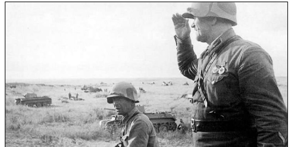
Рис. 7. Советские войска в битве при Халкин-Гол.

Войсками командовал комкор Г.К. Жуков . Японцы потеряли 18 тыс. человек , РККА 2,4 тыс. Военные действия завершились в сентябре победой Красной Армии .