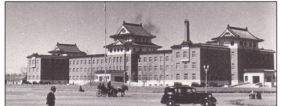
Рис. 6. Штаб-квартира Квантунской армии 1919 - 1945 гг.

Июль 1937 г. Япония начинает вторжение в Китай. СССР с 1937 по 1938 гг. оказывали военную помощь Китаю.