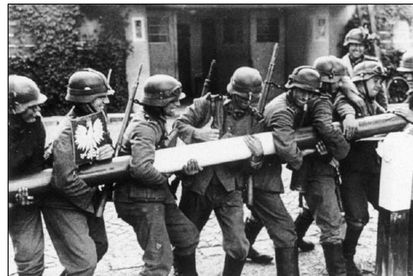
Рис. 12. Солдаты вермахта ломают шлагбаум на пограничном пункте в Сопоте (граница Польши и Вольного города Данцига), 1 сентября 1939 г.

28 сентября 1939 г. Риббентроп и Молотов подписали договор о дружбе и границе и новые секретные протоколы (Германия «уступала» СССР Литву за ряд районов в Восточной Польше).