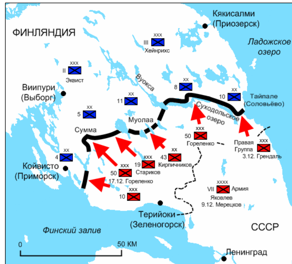
Рис. 13. Карельский перешеек. Карта боевых действий. Декабрь 1939 г.

Советские войска увязли в эшелонированной системе укреплений линии Маннергейма и Карельском перешейке .