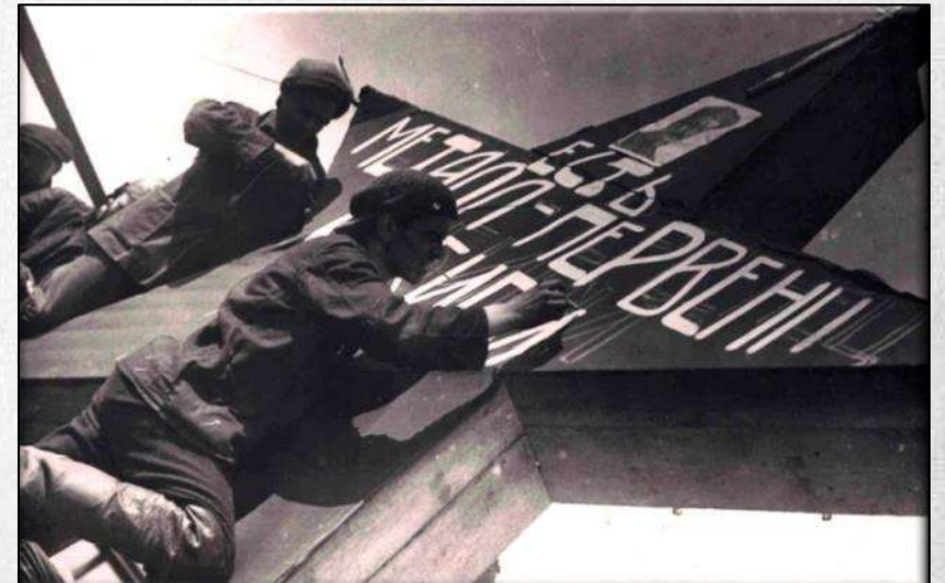
Рис. 16. Выданы первые плавки броневого металла на Кузнецком металлургическом заводе. Сталинск (Новокузнецк). 1941 г.

За годы войны за боевые подвиги на фронтах и героический труд в тылу тысячи металлургов были удостоены боевых и трудовых правительственных орденов и медалей, а девять человек удостоены звания Героя Советского Союза.