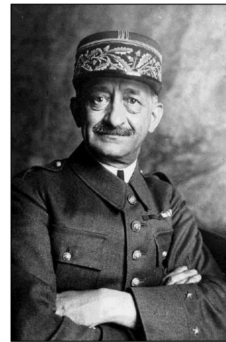
Рис. 9. Генерал Айме Думенк, глава французской делегации.